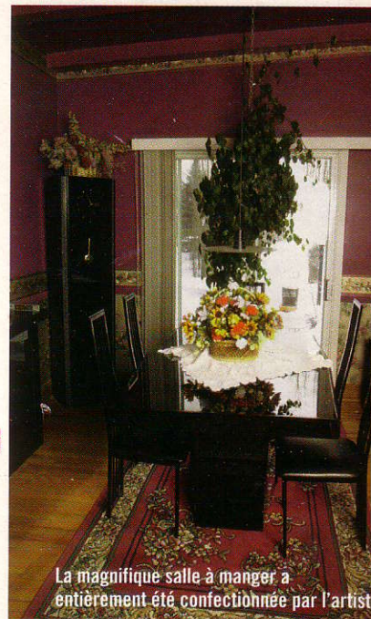
La magnifique salle à manger a entièrement été confectionnée par l'artiste.